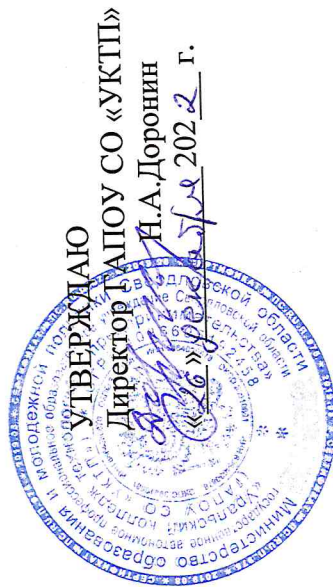
ГРАФИК Государственной итоговой аттестации Демонстрационный экзамен в мае 2023 года в группах ПШССЗ